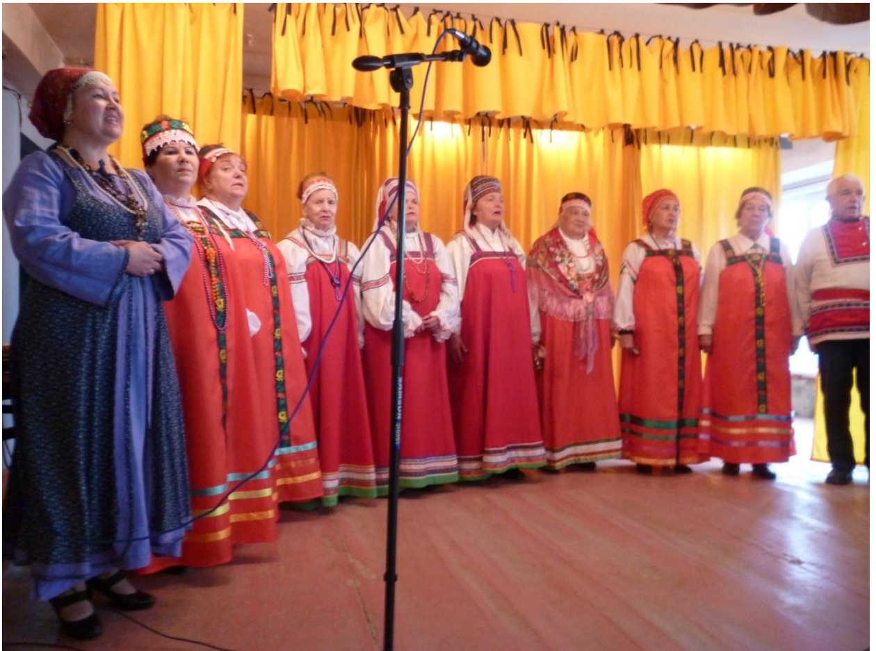
Вечер встречи: «Нам года не беда» 1 октября 2017 года