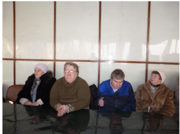
21 января 2016 года Музыкальный вечер «МАЭСТРО» к 80 – летию со дня рождения композитора Р.Паулса.