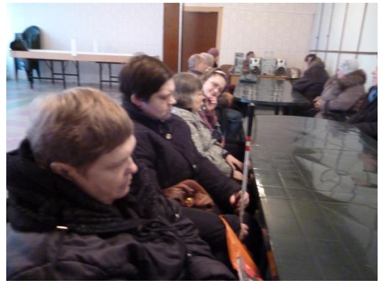
Литературно-музыкальный вечер «Возьмёмся за руки друзья» 24 ноября 2016 года