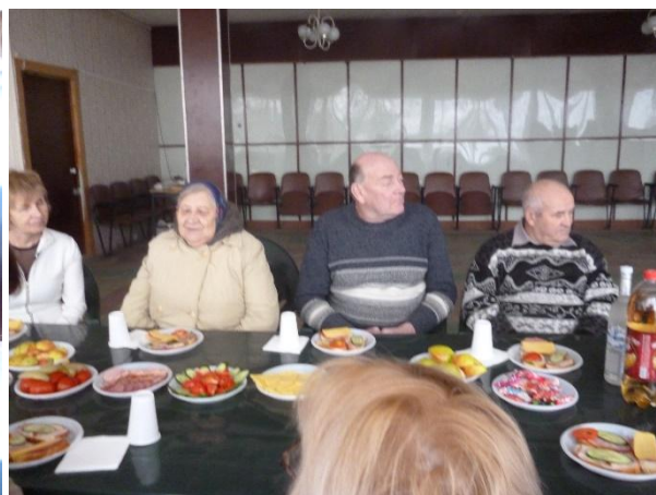
Литературно – музыкальный вечер «Золотая душа», посвящённый юбилярам года, членам ВОС Боровской местной организации. 15 февраля 2020 года