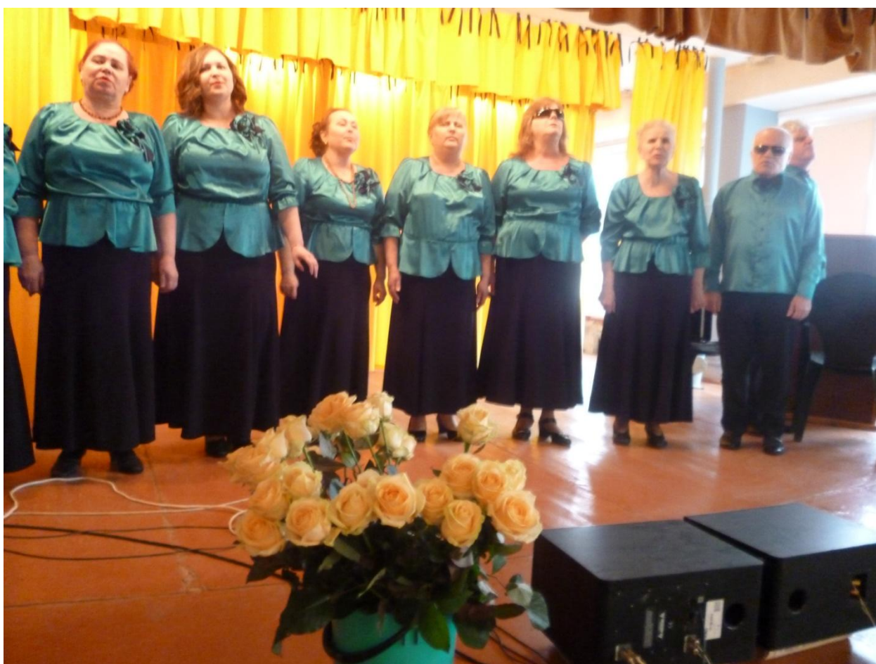
Вечер отдыха «Нашим неповторимым, дорогим и любимым» (Международный Женский День 8 Марта)