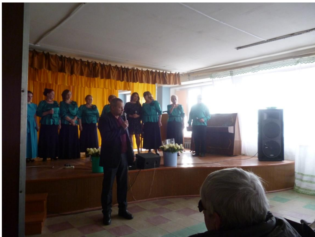
Вечер отдыха: «С добром, любовью и весной» к Международному женскому дню 8 марта 6 марта 2019 года