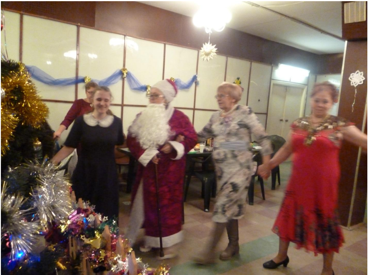
Новогодний вечер отдыха «Праздник пожеланий и надежд» 21 декабря 2019 года