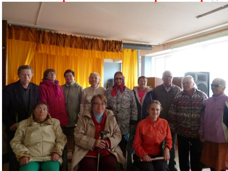
Музыкальный вечер «Ах! Шансон...» 15 сентября 2016 года