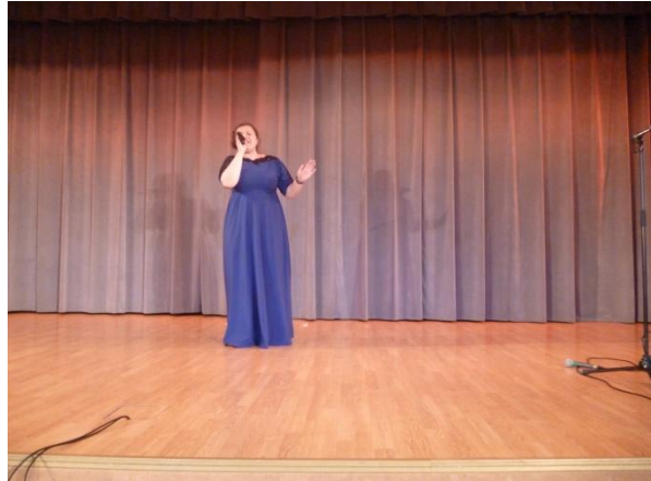
Музыкальный вечер патриотической песни «Живые, пойте о нас» г. Москва КСРК ВОС 21 мая 2016 года