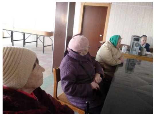
Музыкальный вечер «Нежный гений гармонии» (к 210 – летию со д.р. Федерика Шопена) 6 февраля 2020 года