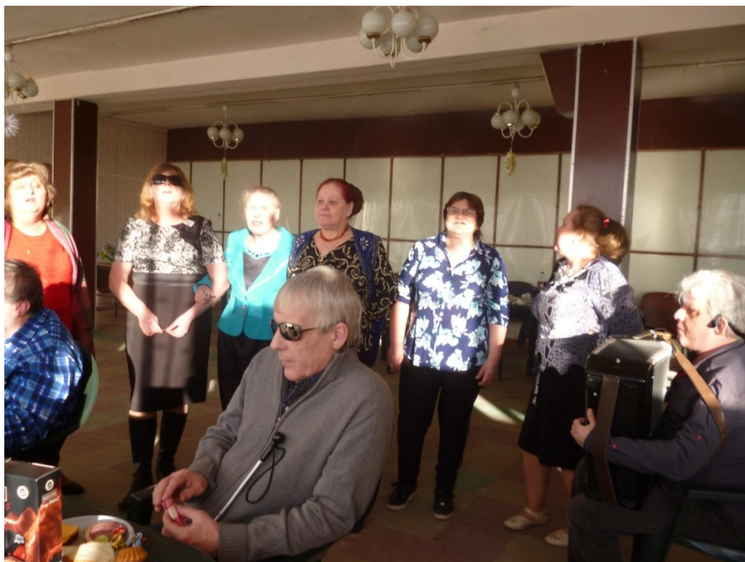
Литературно – музыкальный вечер «Золотая душа», посвящённый юбилярам года, членам ВОС Боровской местной организации. 17 февраля 2019 года