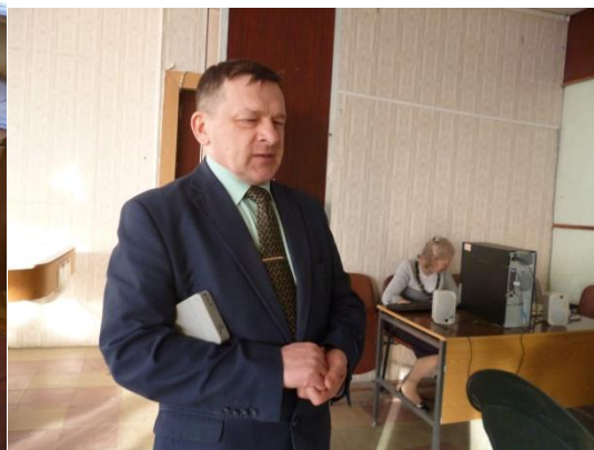
Вечер: «Я не верю судьбе» к 80 летию со дня рождения В.Высоцкого 25 января 2018 года