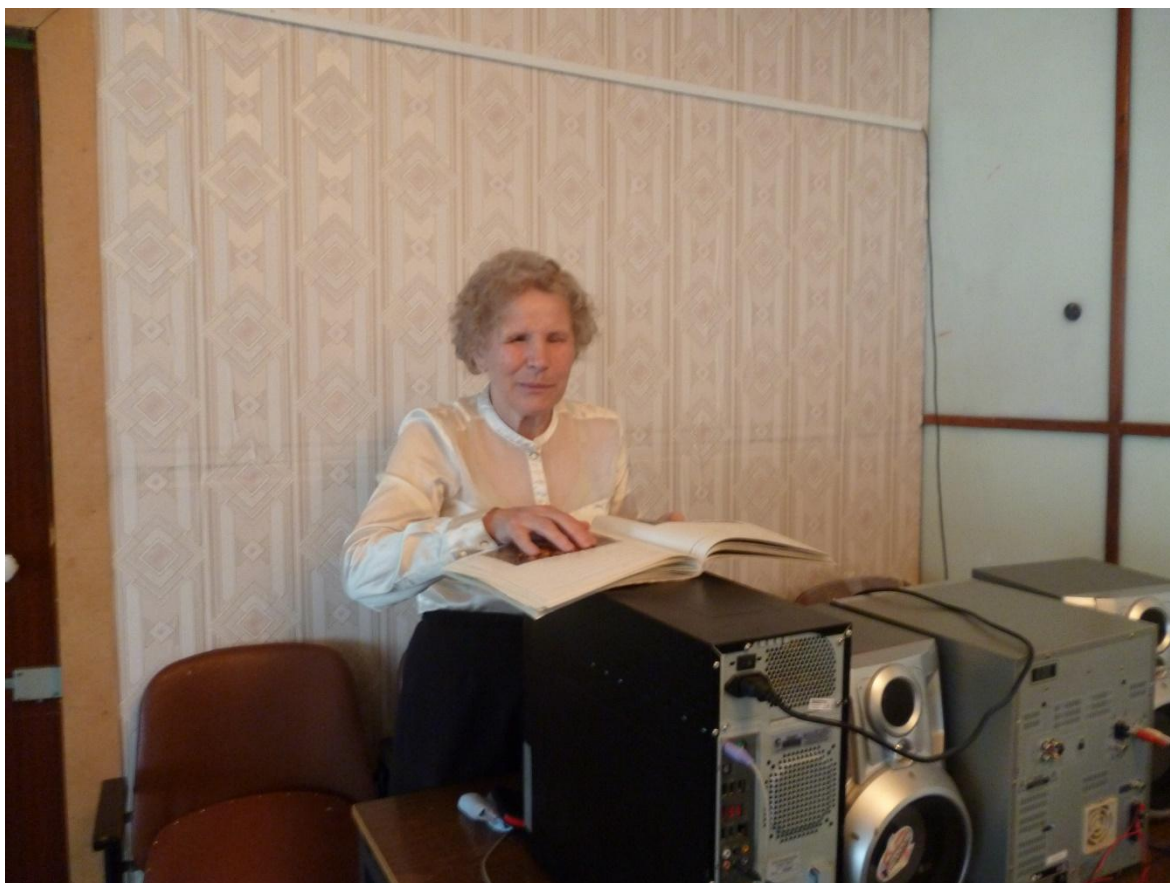
9 июня 2016 года Музыкальный вечер «Очень мало нот, но много музыки» о жизни и творчестве композитора Г. Свиридова.