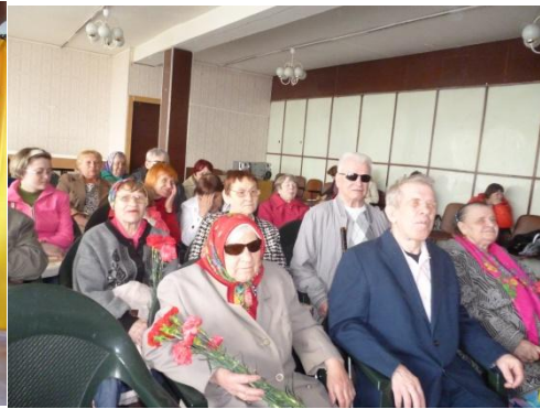
Музыкальный вечер «Минувших дней святая память» май 2016