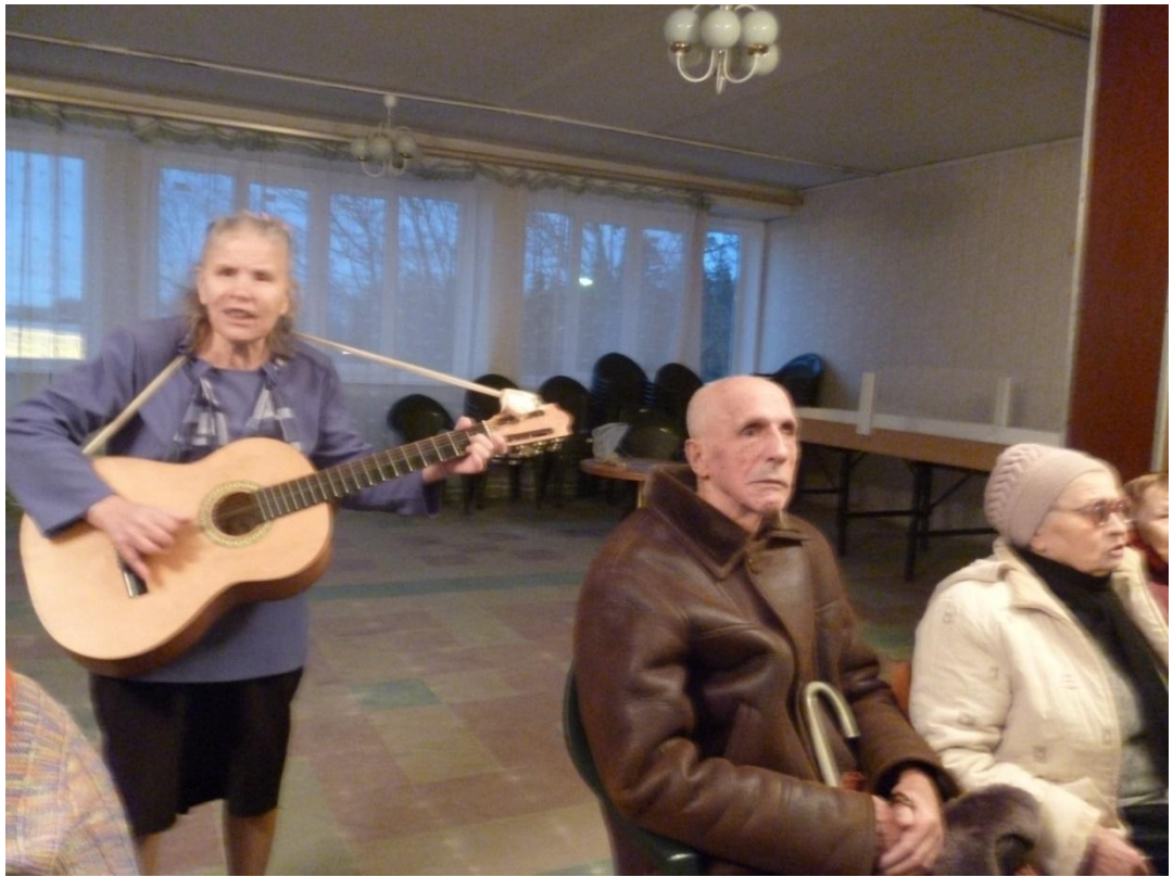
Музыкальный вечер «Главное, ребята, сердцем не стареть». (к 90 – летию со д. р. поэта – песенника Н. Добронравова). 22 ноября 2018 года