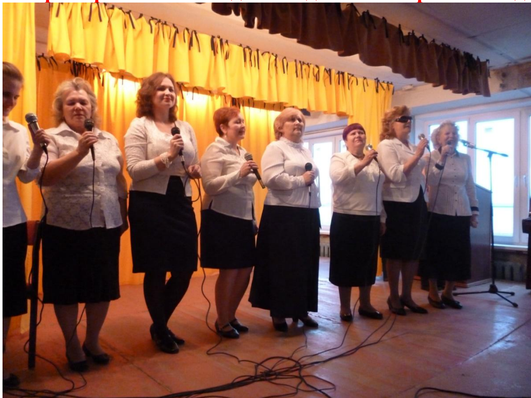
Вечер отдыха: «Радость жизни замечая» ко Дню слепого человека 18 ноября 2017 года