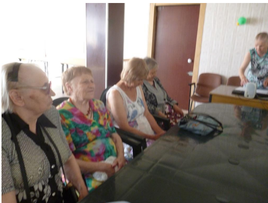
Литературно – музыкальный вечер «Как живёшь ты, отчий дом?» Жизнь и творчество поэта – песенника А. Дементьева. 28 июня 2018 года