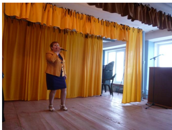
Литературно – музыкальный вечер: «Золотая душа», посвящённый юбилярам года, членам ВОС Боровской местной организации. 25 февраля 2018 года