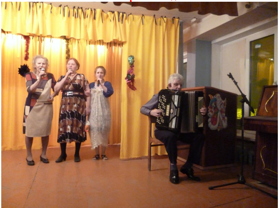
Новогодний вечер для слабовидящих «Желаем счастья Вам!» 22 декабря 2018 года