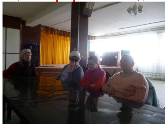
Музыкальный вечер: «Истинно русский певец» (к 145 – летию со д. р.Ф.И. Шаляпина 22 марта 2018 года