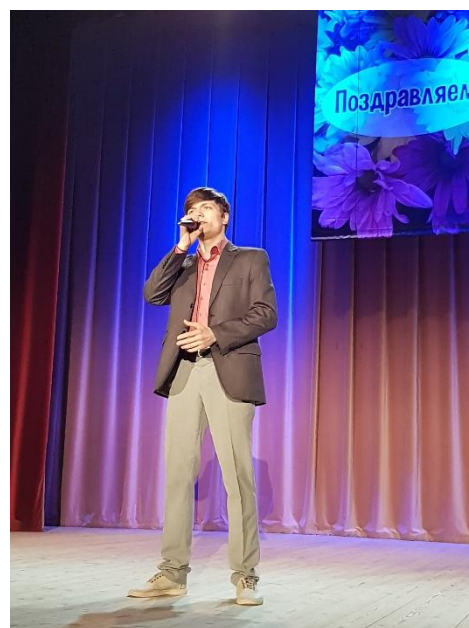
Концерт: «Стихи для мамы» 23 марта 2018 года