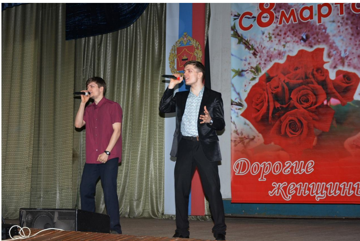
Концерт к Международному женскому дню 8 марта ДК «Ракетчик» г. Балабаново-1 7 марта 2019 года