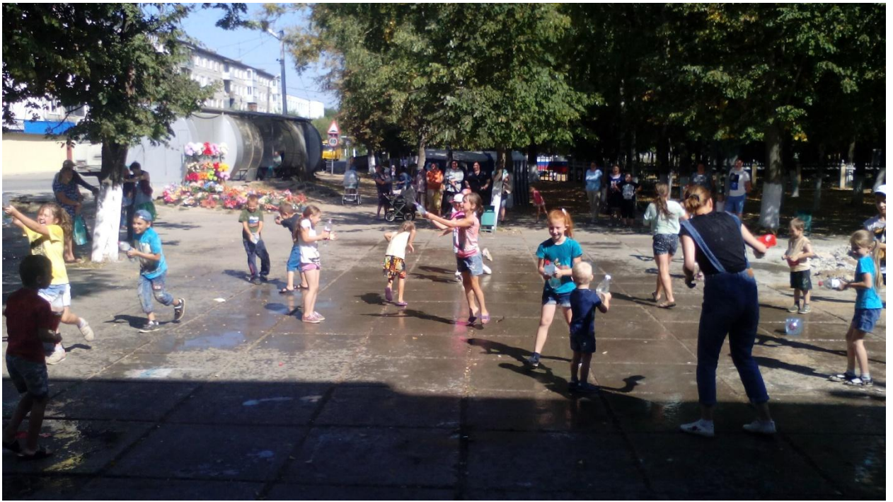
Праздник: «День Нептуна» 27 августа 2018 года