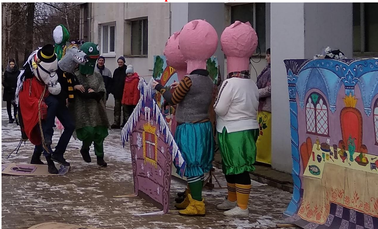
Народное гуляние «Широкая масленица» 10 марта 2019 года