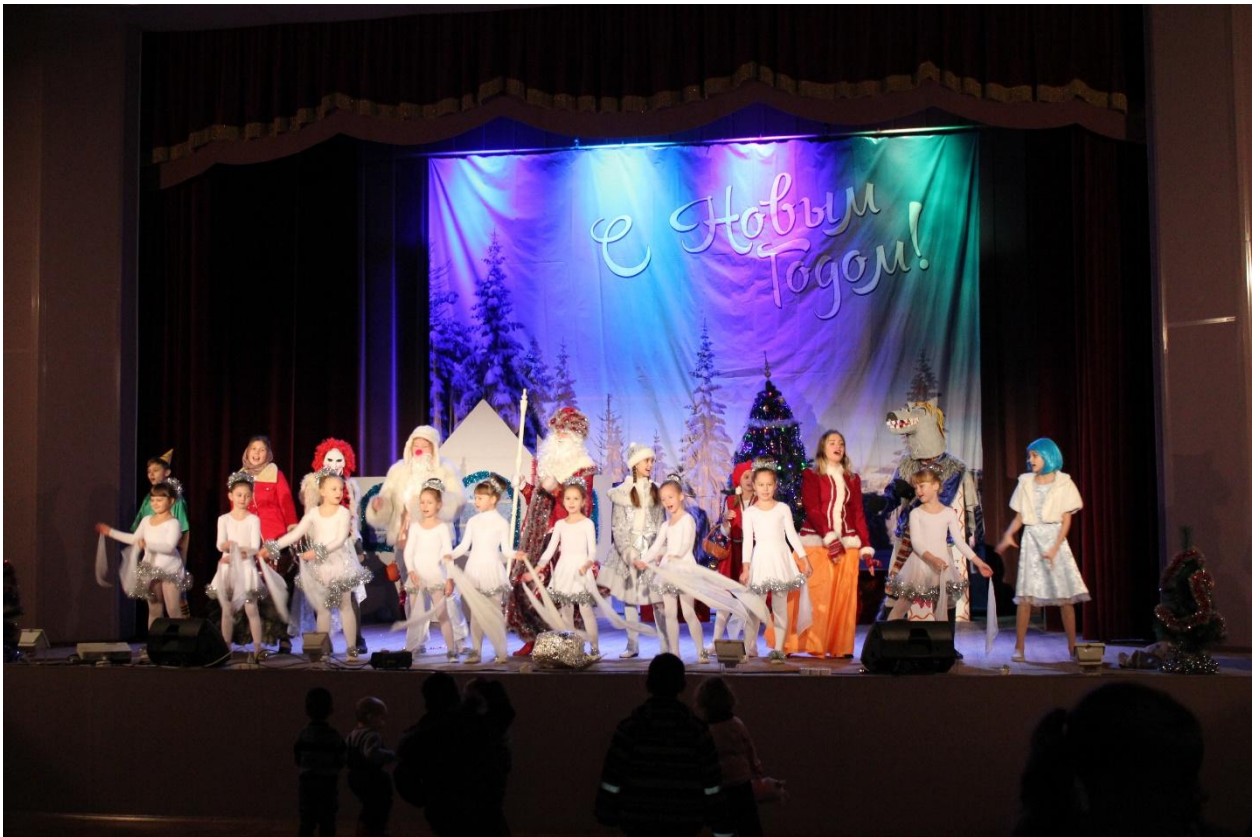
Новогодняя сказка для детей: «Новогодний переполох» 29 декабря 2018 года