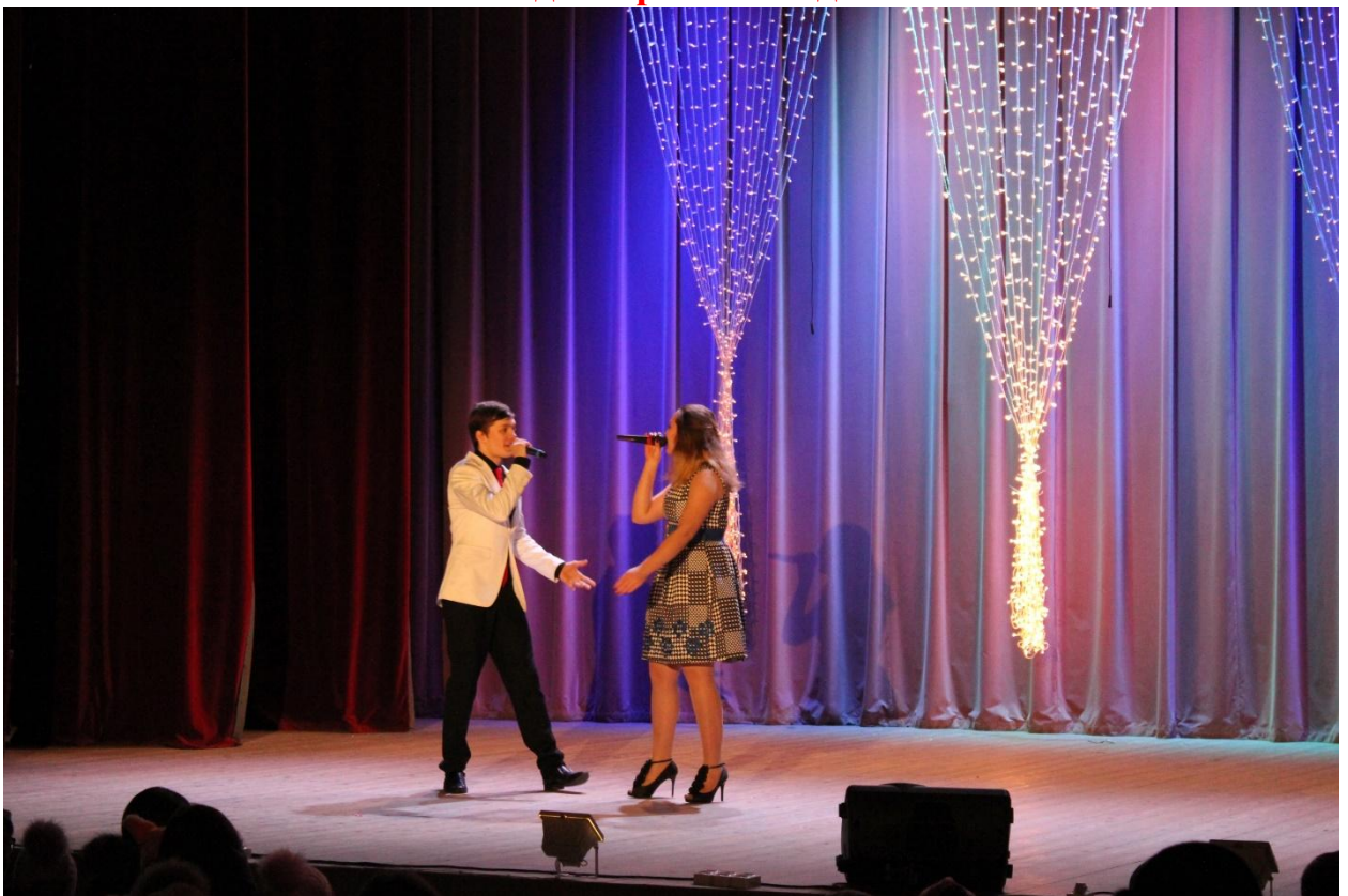
Старо новогодний концерт 12 января 2019 года