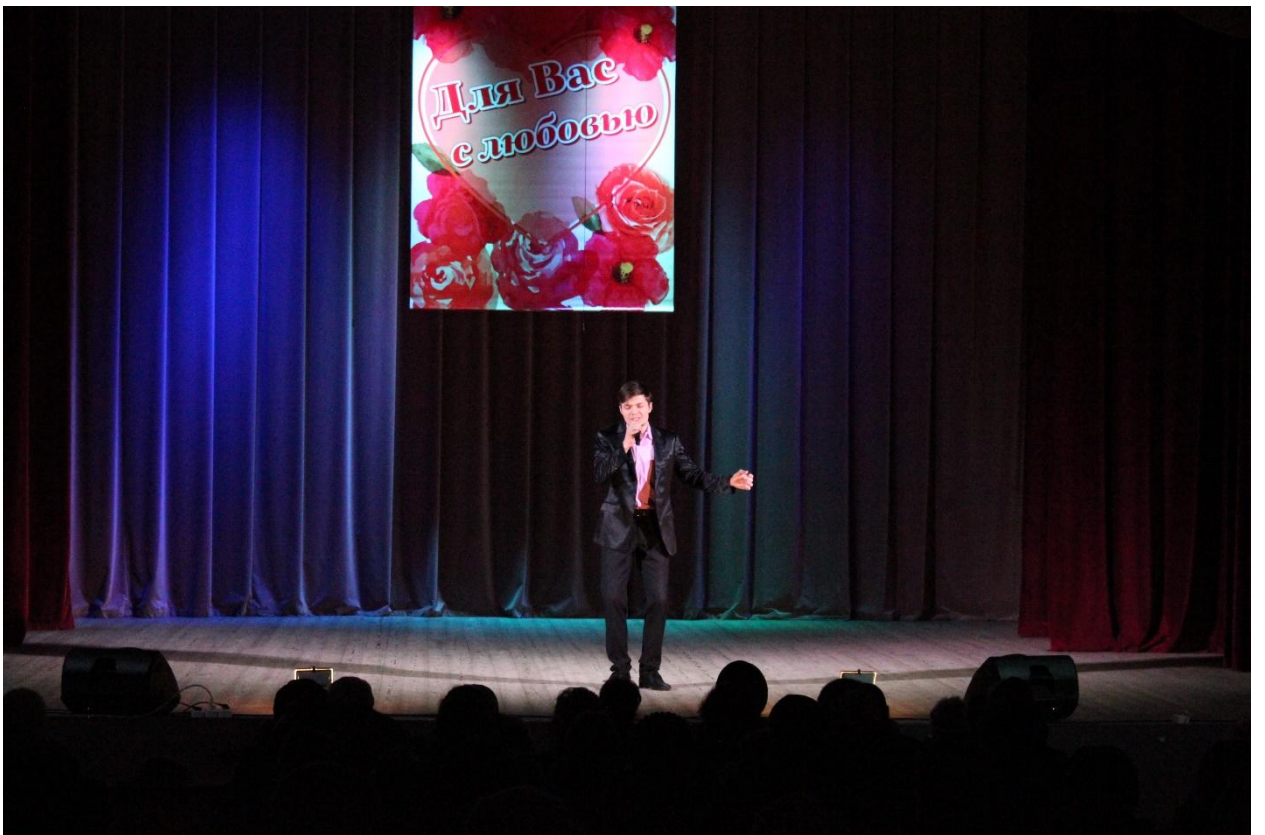
Концерт День инвалида 1 декабря 2019 года