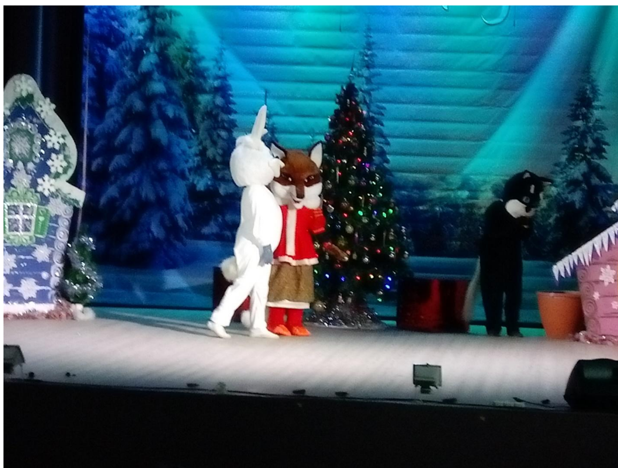
Новогодняя сказка для детей «Лекарство от жадности» 26 декабря 2019 года