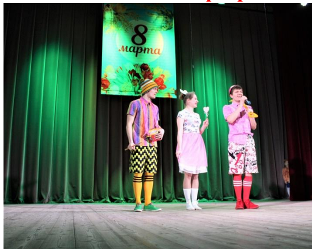
Концерт посвящённый Международному дню 8 марта 6 марта 2020 года