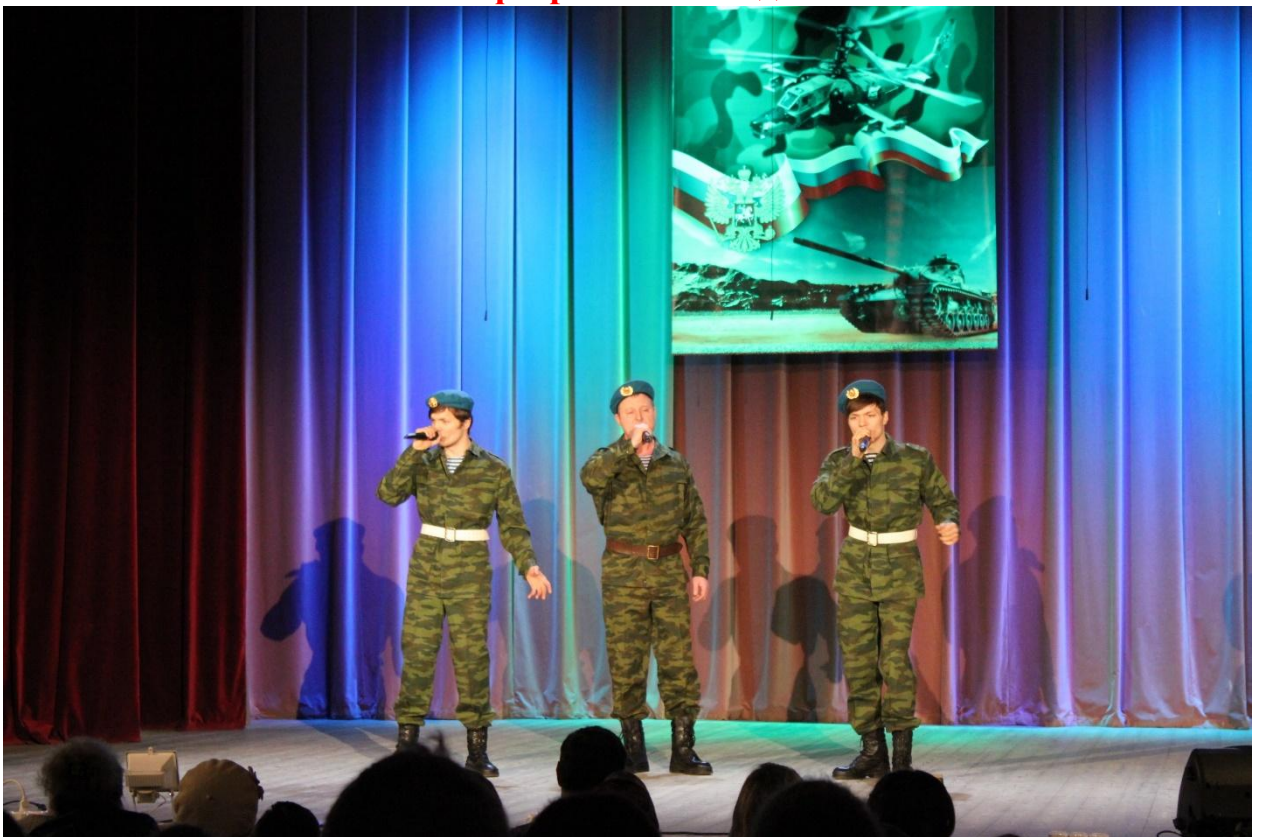
Концерт посвящённый Дню защитника Отечества 22 февраля 2019 года