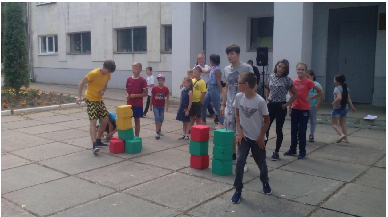
Игровая программа посвящённая Дню физкультурника 9 августа 2018 года