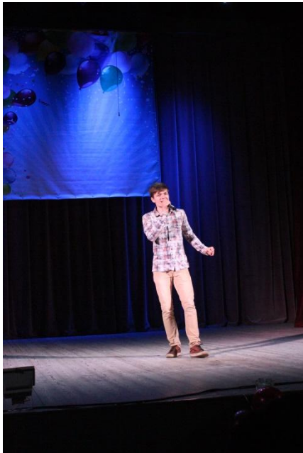
Концерт День молодёжи 28 июня 2019 года