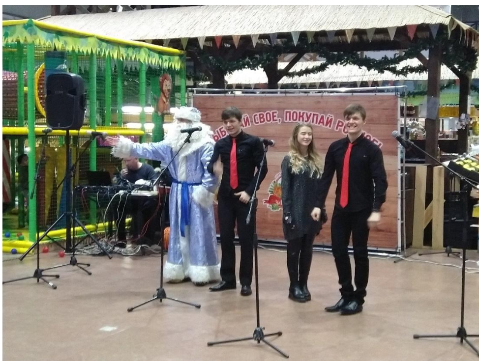
Концерт посвящённый 75 летию Дому народного творчества и кино «Центральный» г. Калуга 14 декабря 2019 года