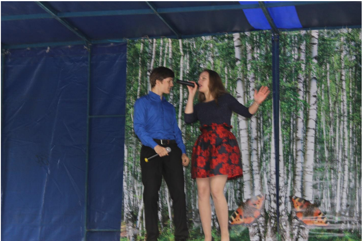
Выступление на «Дне города», Дне России» и «Дне текстильщика» 10 июня 2018 года