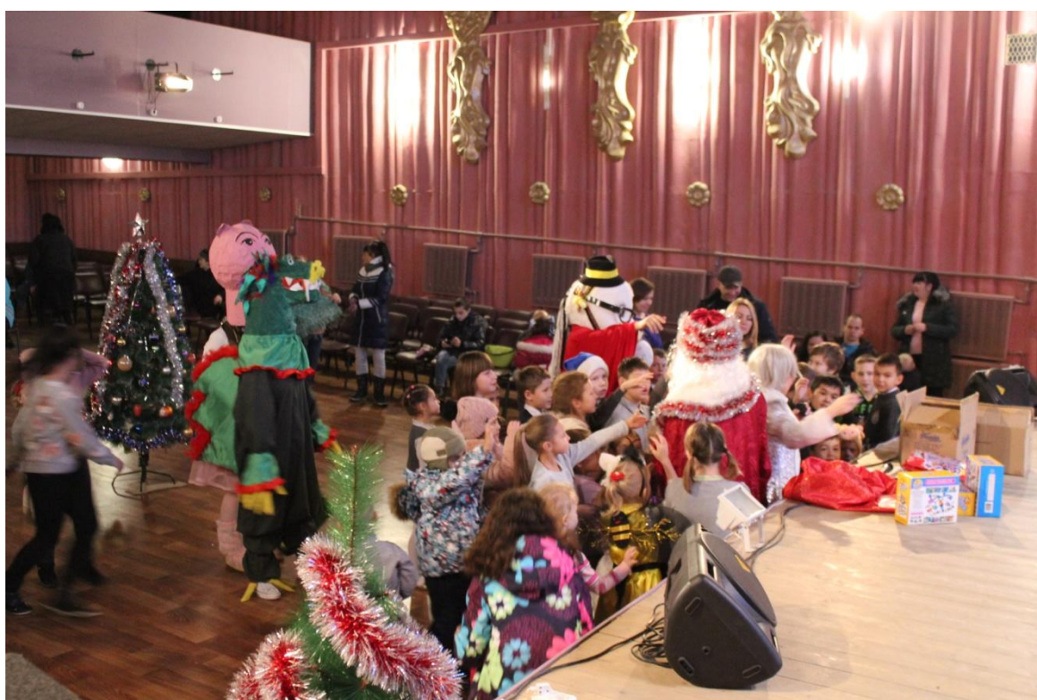
Игровая программа и вручение новогодних подарков детям малообеспеченных и многодетных семей 27 декабря 2018 года