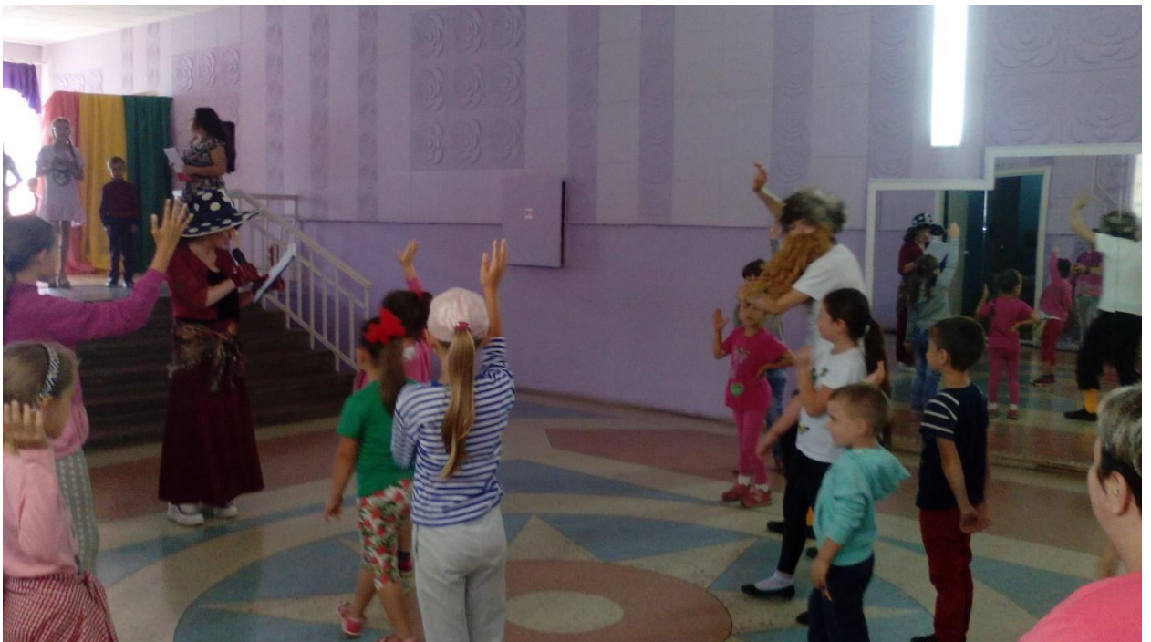
Праздник: «Прощай лето» 31 августа 2018 года