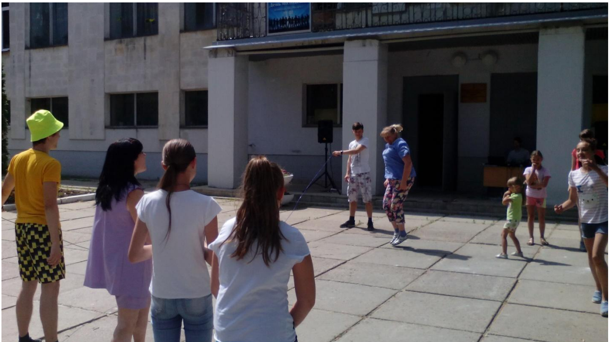
Игровая программа: «День семьи, любви и верности» 29 июня 2018 года