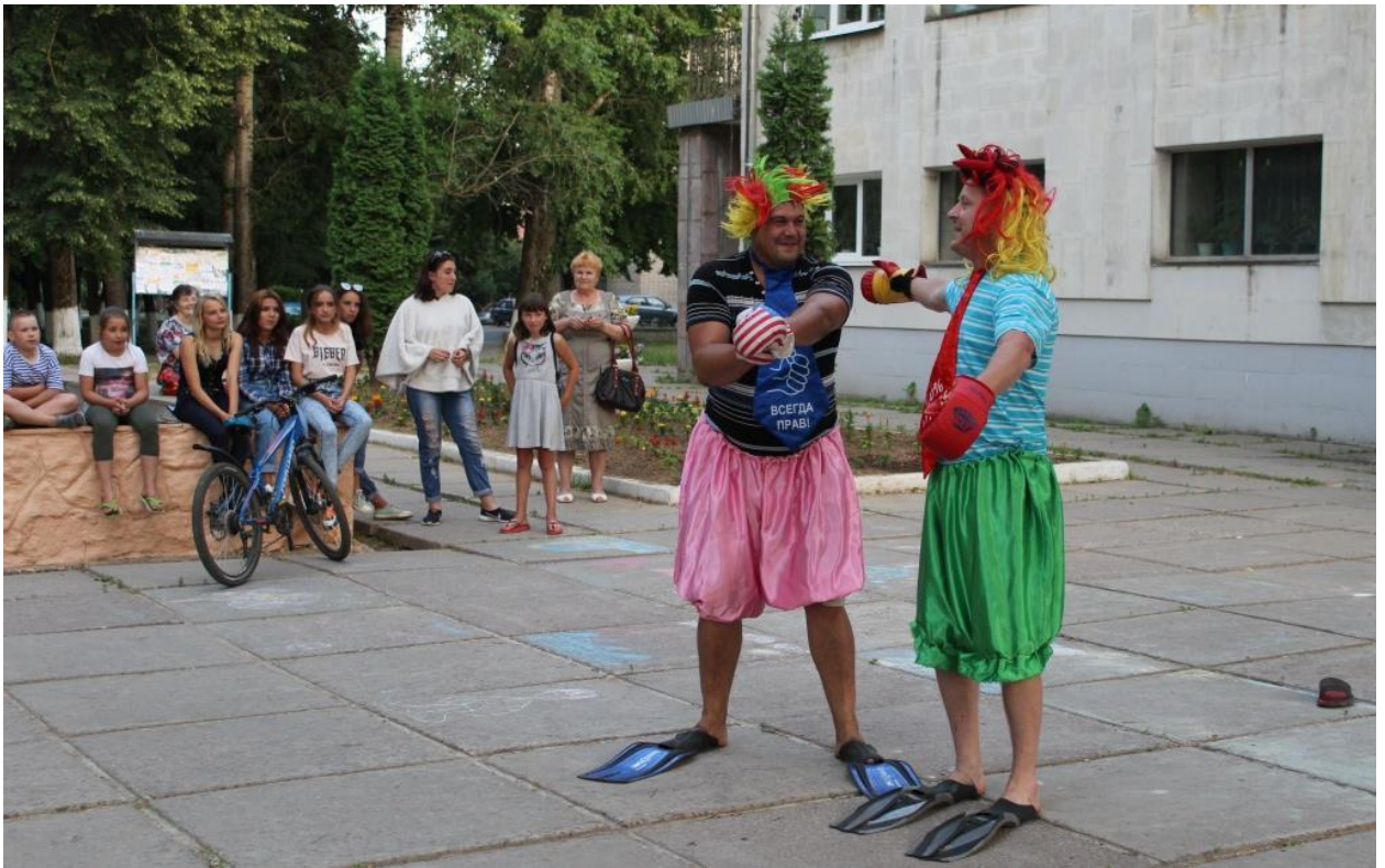
День молодёжи 29 июня 2018 года