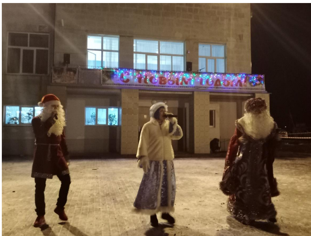
Новогодняя ночь 1 января 2020 года