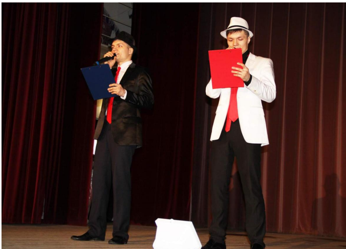
Концерт посвящённый Международному женскому дню 8 марта МУК ДК «Полёт» 7 марта 2018 года.