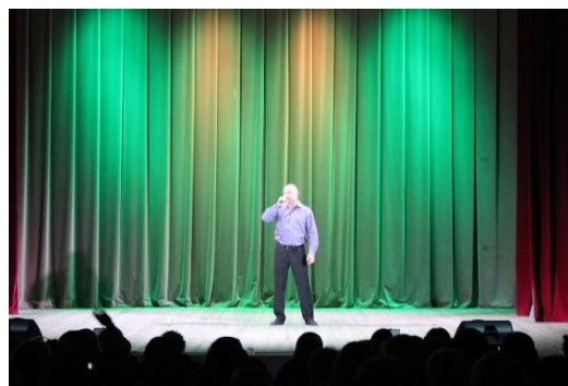
Вечер встречи выпускников Ермолинской средней школы 1 февраля 2020 года