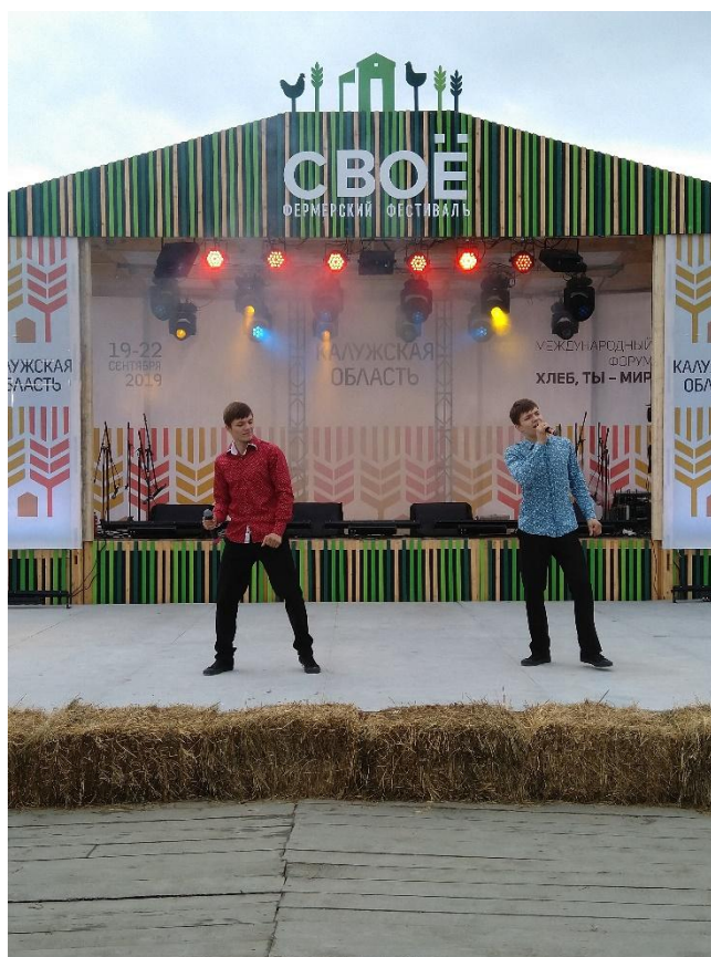
Международный форум "Хлеб-ты мир!" 20 сентября 2019 года Этномир Боровский район