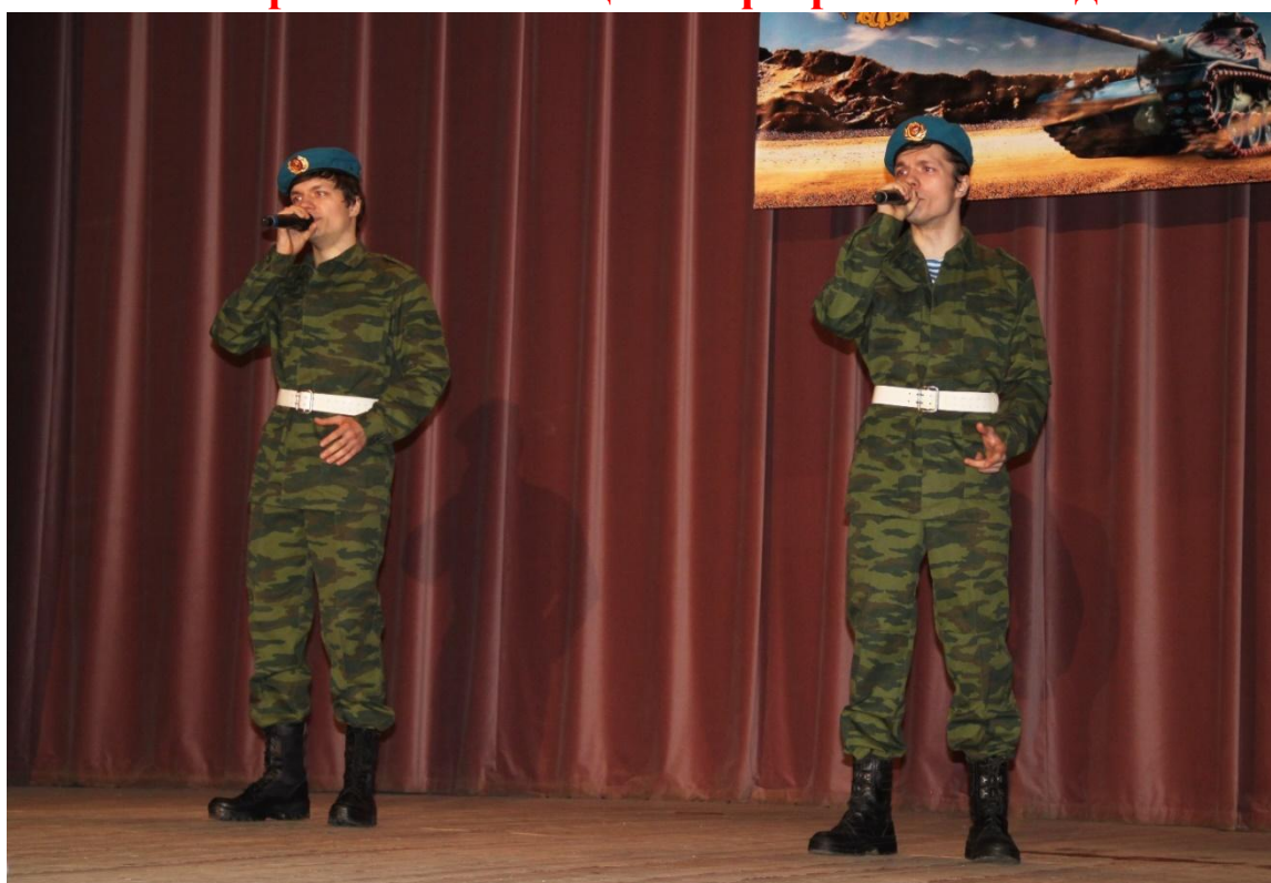
Концерт: «Защитникам Отечества!...» 23 февраля 2018 года