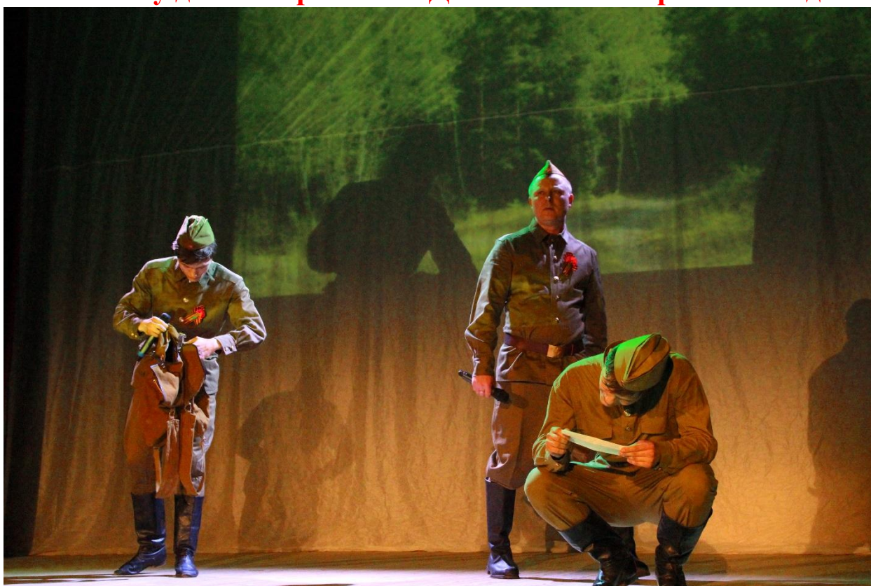
Концерт 9 мая 2018 года «Мы помним...!»