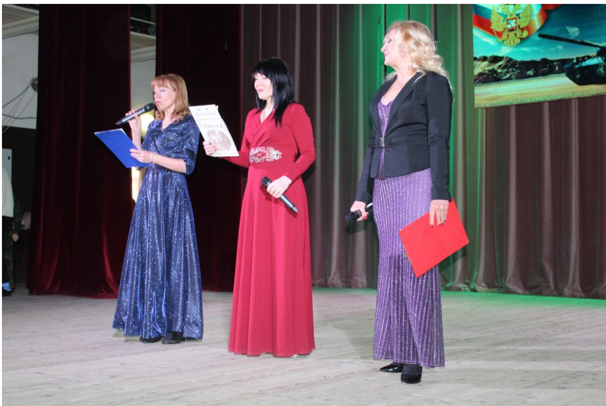
Концерт к Дню защитника отечества 21 февраля 2020 года