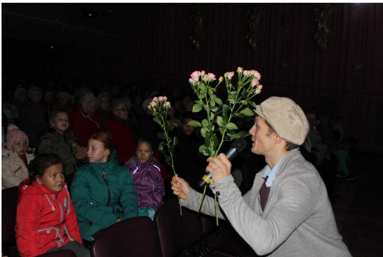
Концерт к Дню пожилого человека 29 сентября 2019 года