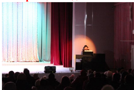
Концерт «Этот старый Новый год!» 13 января 2020 года