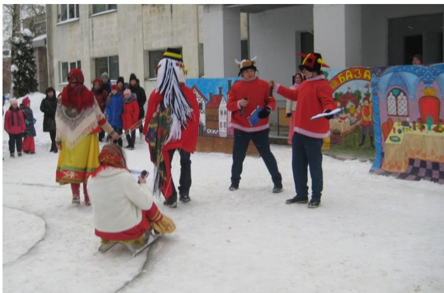
«Широкая масленица» 18 февраля 2018 года