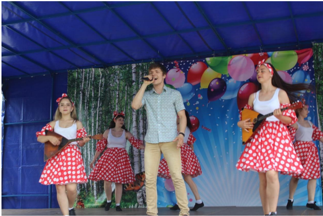
Концерт День России День города День текстильщика 12 июня 2019 года