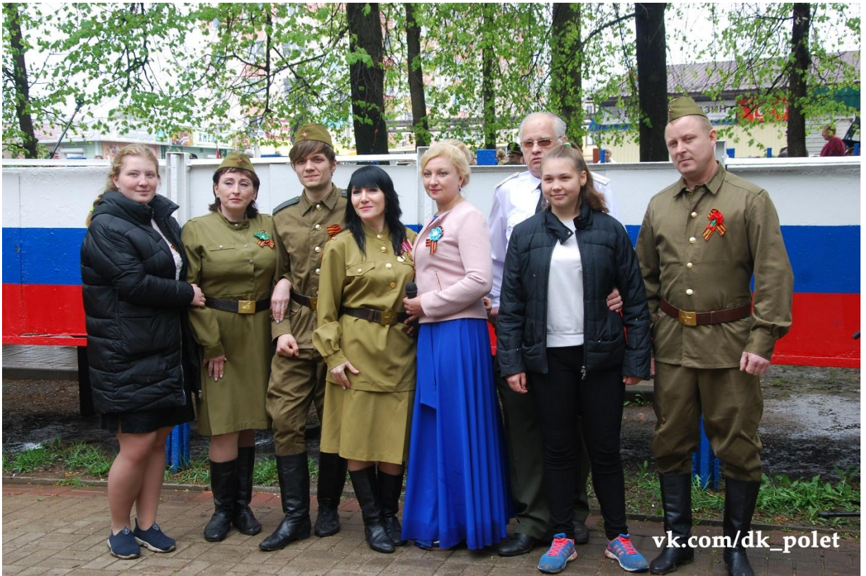
Митинг 9 мая 2019 года в честь 74 годовщины Великой Победы