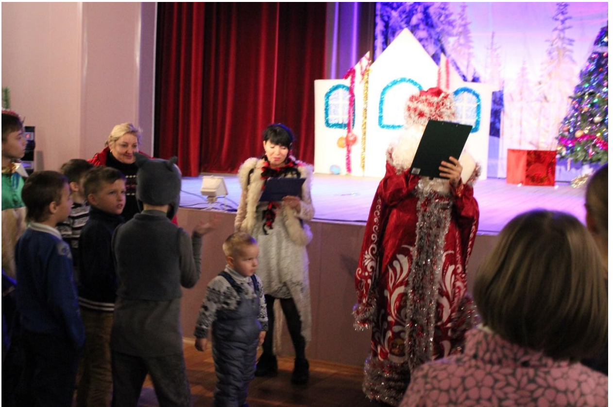
Новогодняя сказка для детей: «Новогодний переполох» 29 декабря 2018 года