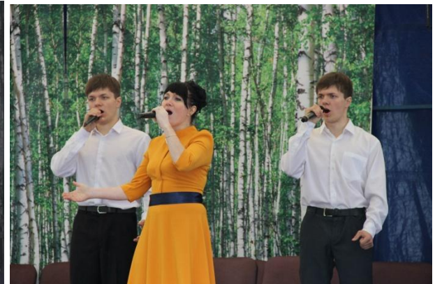
Концерт 12 июня 2016 года «415 лет городу Ермолино»