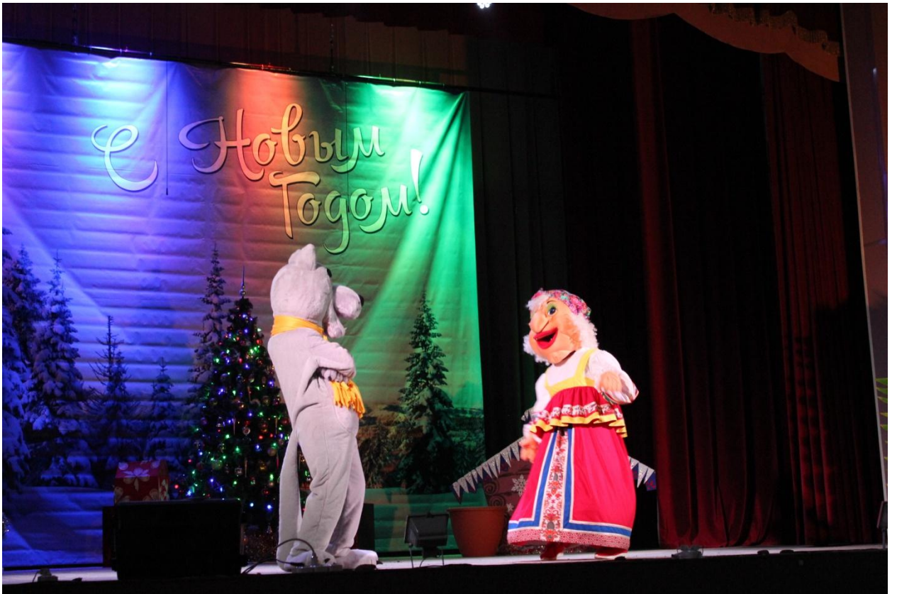
Новогодняя сказка для детей «Лекарство от жадности» 26 декабря 2019 года