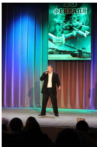
Концерт посвящённый Дню защитника Отечества 22 февраля 2019 года