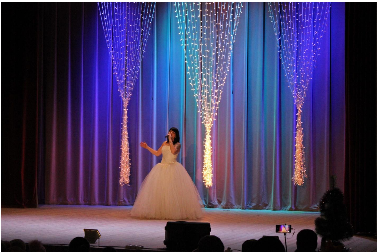
Старо новогодний концерт 12 января 2019 года