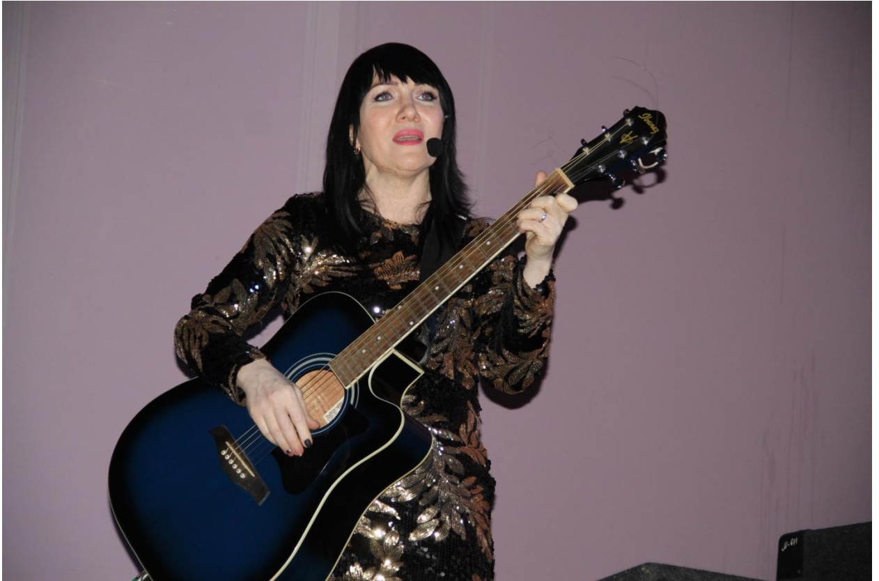
Юбилейный концерт «15 лет Ансамбля эстрадного танца Ритм» 25 января 2020 года