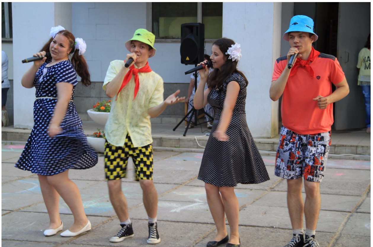
Концерт «Молодёжь против наркотиков» 27 июня 2016 года