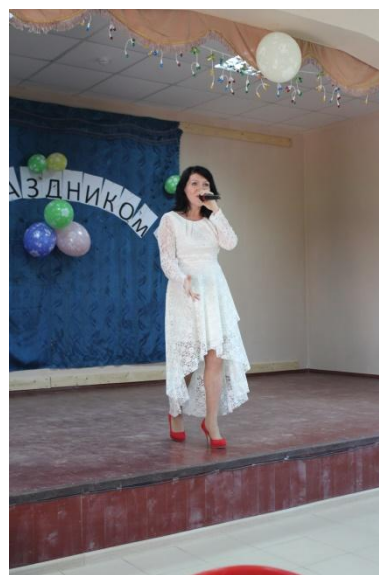
Концерт к Дню пожилых людей 1 октября 2016 года ДК п. Ерденево