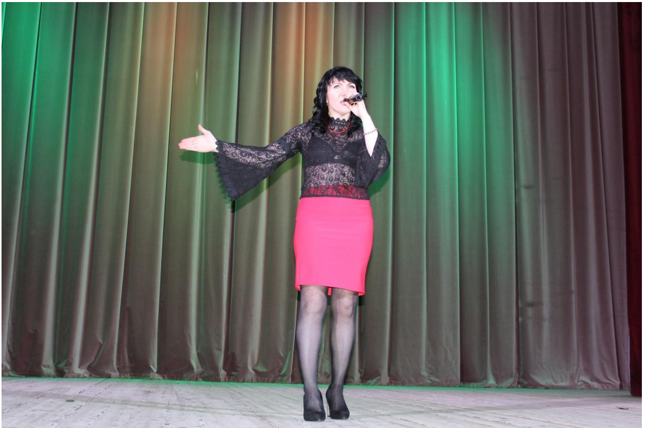
Вечер встречи выпускников Ермолинской средней школы 1 февраля 2020 года