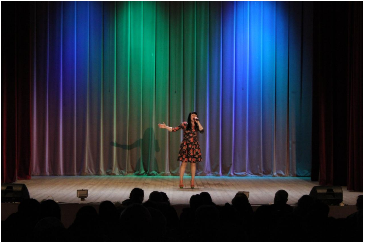
Вечер встречи с выпускниками 2 февраля 2019 года