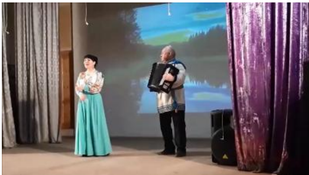
Диплом за 1 место V-й Районный открытый Фестиваль-конкурс народной песни «Славянский мир» СДК д. Кривское 25 мая 2019 года