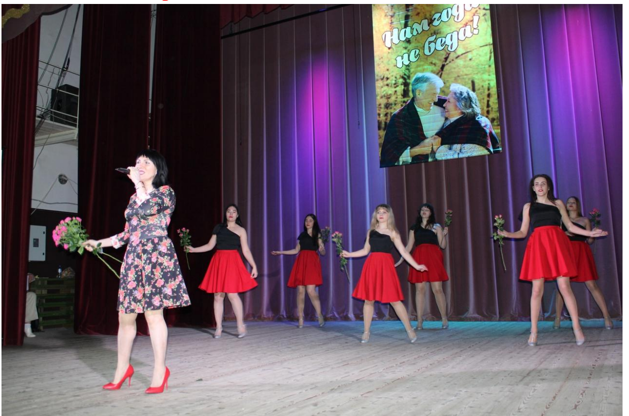
Концерт к Дню пожилого человека 29 сентября 2019 года