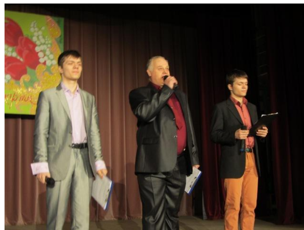
Концерт 7 марта 2016 года