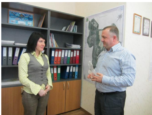
Вручение заслуженной награды

Студия подготавливает профессиональные номера, театрализованные постановки для мероприятий ДК. Отличается профессионализмом, быстрой подготовкой номеров художественной самодеятельности, мобильностью. Незаменима при проведении не запланированных мероприятий.