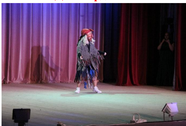
Концерт «Нам года не беда» 4 октября 2016