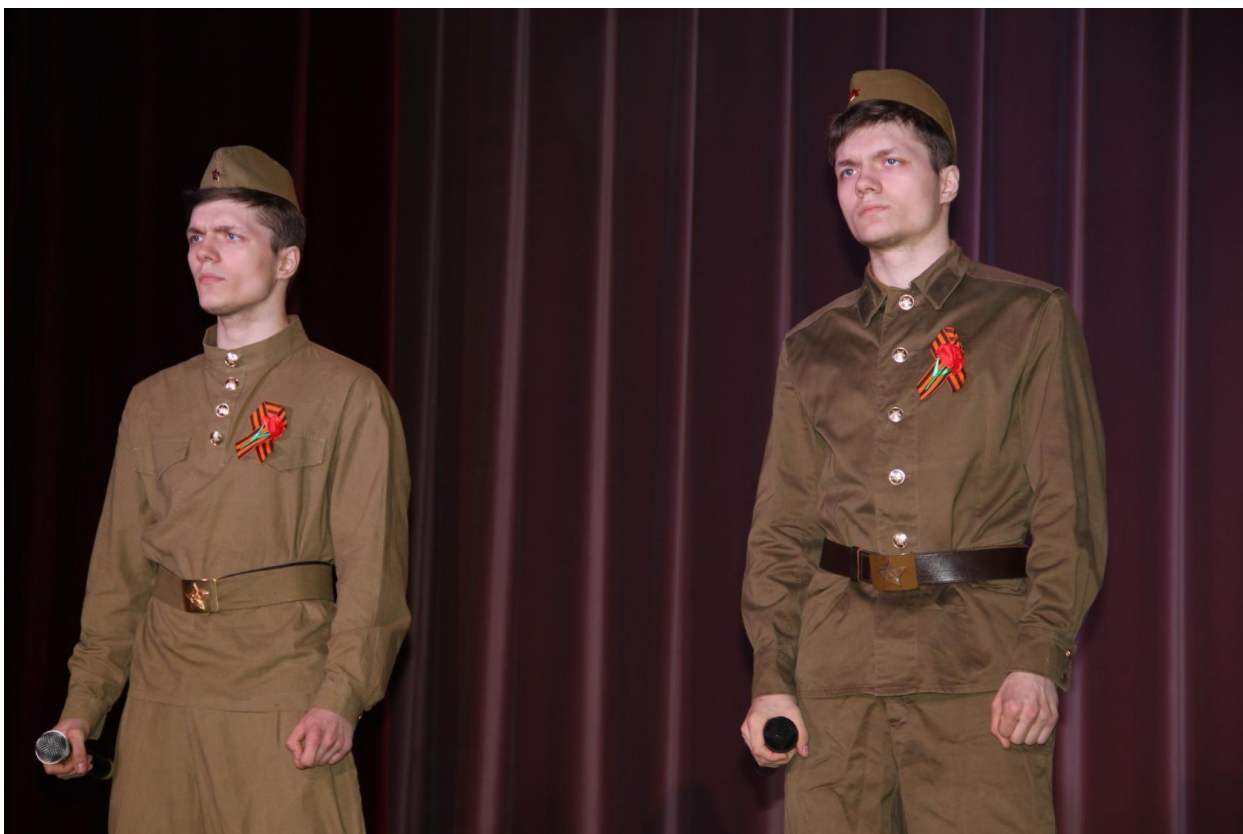
Концерт: «Спасибо ветераны!» 9 мая 2017 года