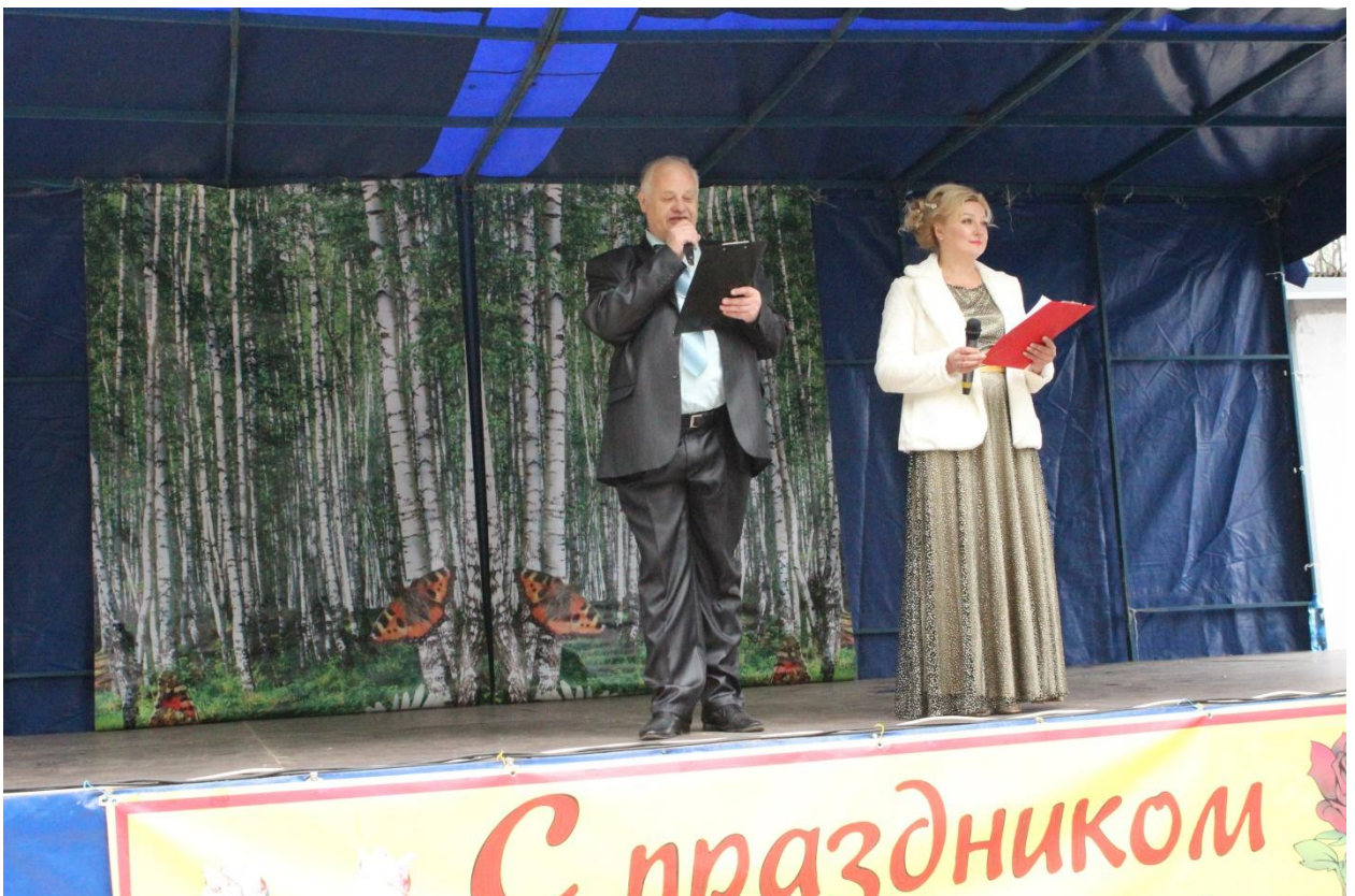
Выступление на «Дне города», Дне России» и «Дне текстильщика» 10 июня 2018 года