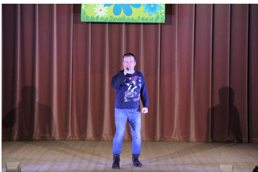
Концерт к Дню жилищно-коммунального хозяйства 15 марта 2017 года