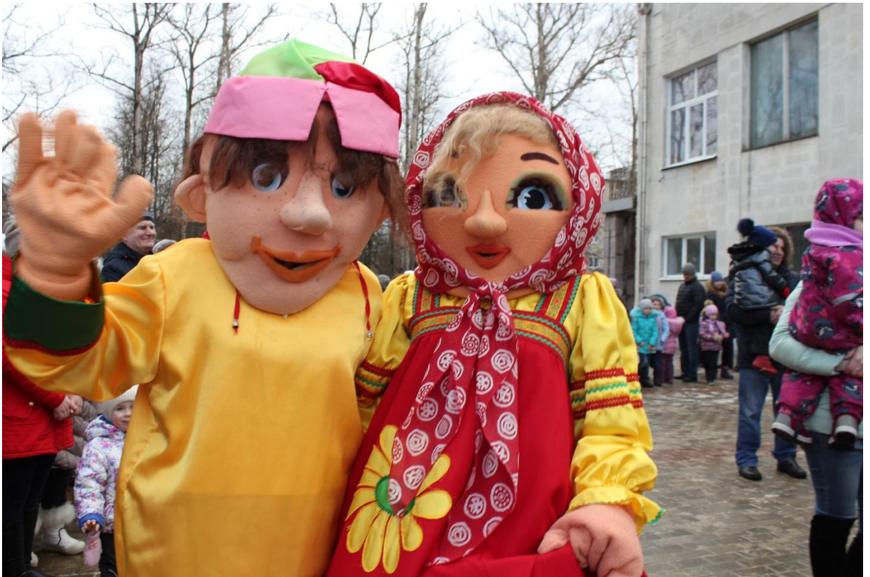
Народное гуляние «Широкая масленица» 10 марта 2019 года