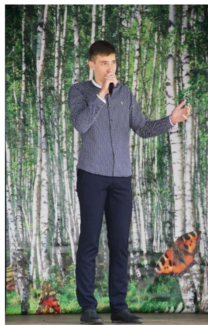
Концерт «День города» 10 июня 2017 года