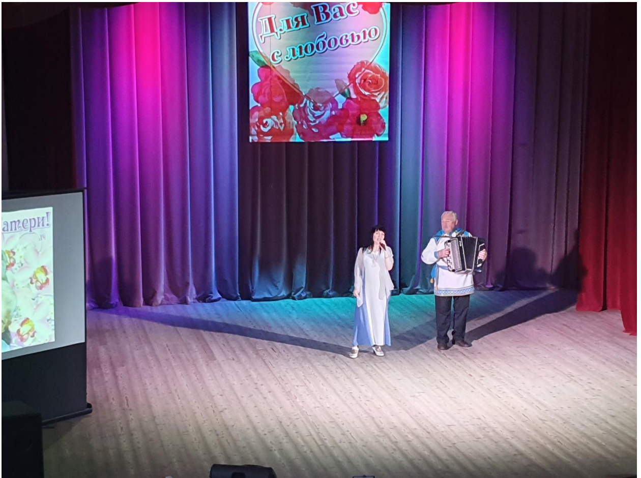
Концерт посвящённый Дню матери 20 ноября 2019 года