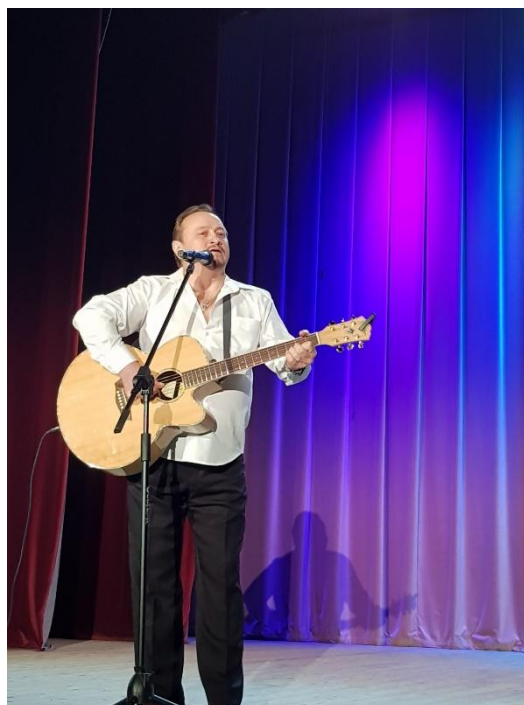
Концерт: «Стихи для мамы» 23 марта 2018 года