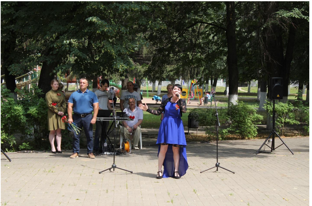
Митинг посвящённый Дню памяти и скорби 22 июня 2019 года