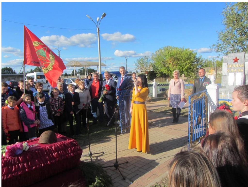
Митинг посвящённый 75-летию освобождения Калужской области от немецко-фашистских захватчиков 17 сентября 2018 года