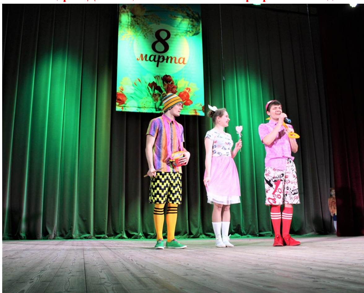
Концерт посвящённый Международному дню 8 марта 6 марта 2020 года