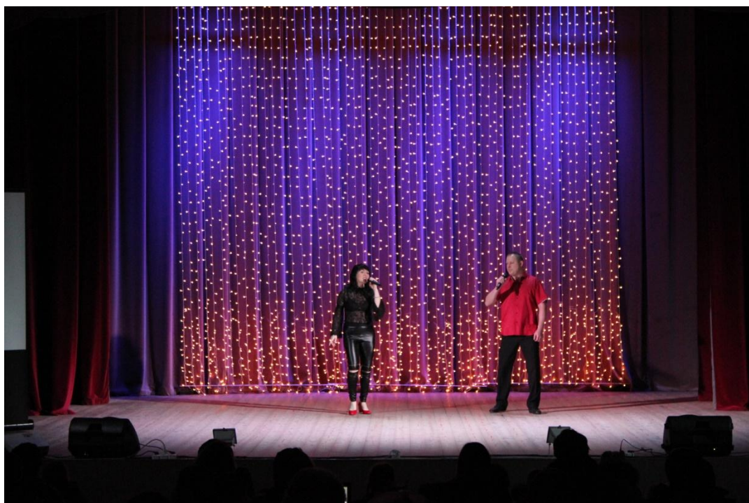
Концерт «Этот старый Новый год!» 13 января 2020 года