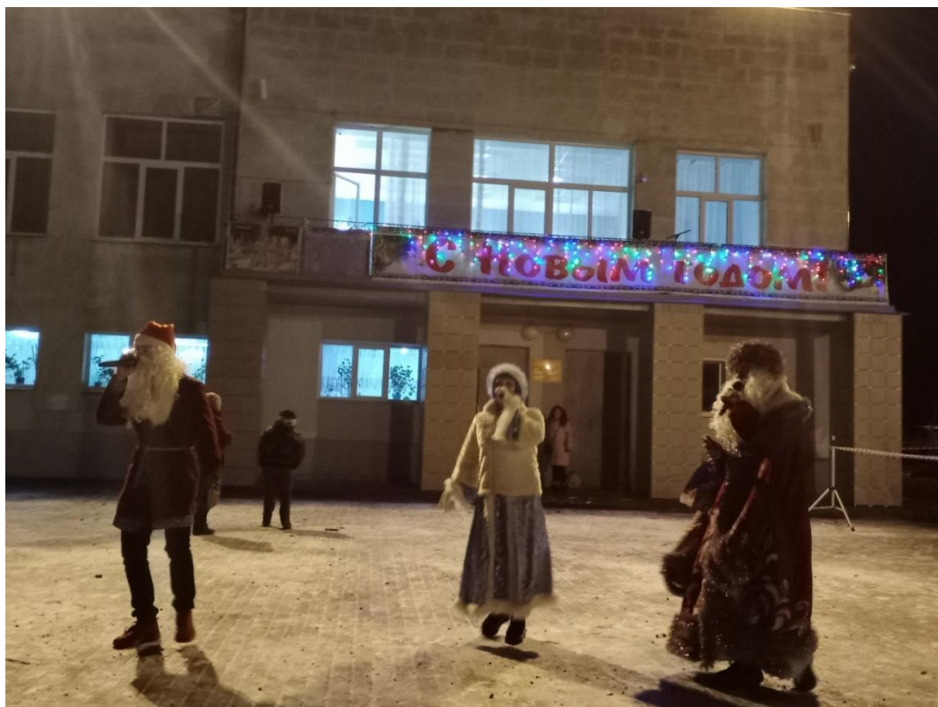
Новогодняя ночь 2020