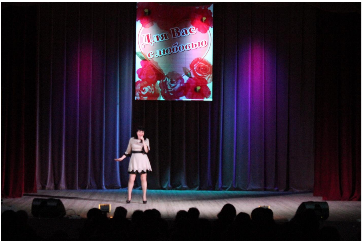
Концерт День инвалида 1 декабря 2019 года