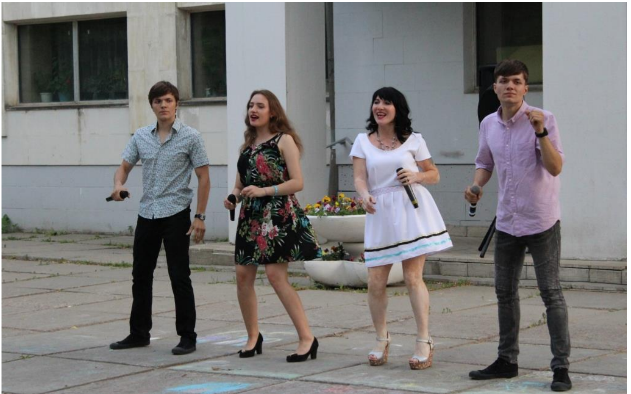
День молодёжи 29 июня 2018 года