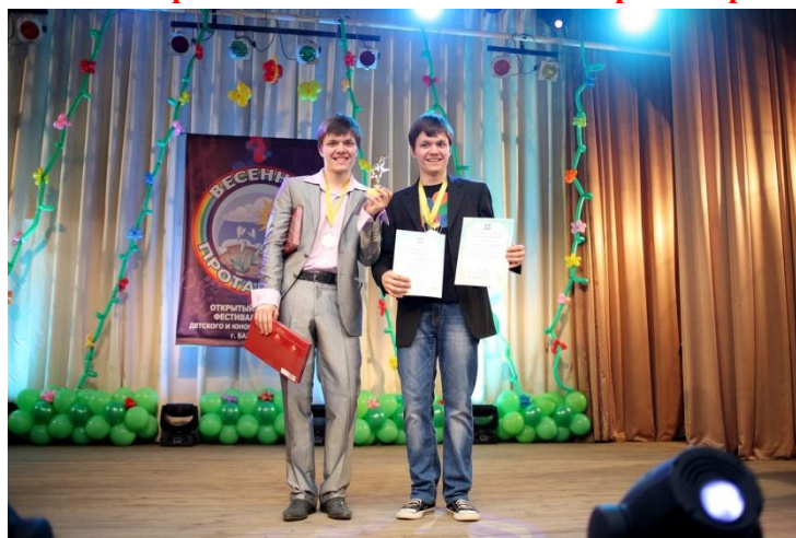
ХIII Открытый городской в рамках районного фестиваль-конкурс детского и юношеского творчества «Весенние проталинки» г. Балабаново 4 - 8 апреля 2016 года