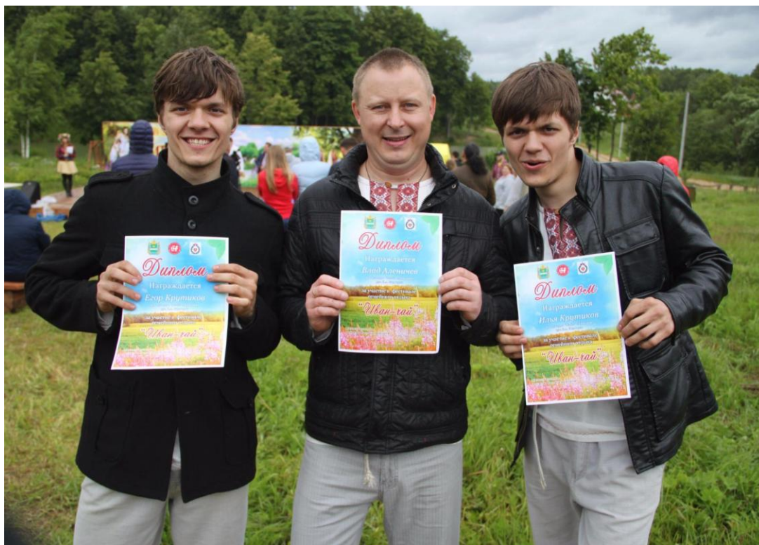
Фестиваль семейного отдыха «Иван-чай» природный парк Ивановское 8 июля 2017 года