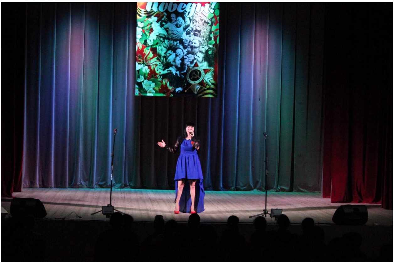
Музыкально-тематический утренник «Военной песни негасимый свет». 6 мая 2019 года