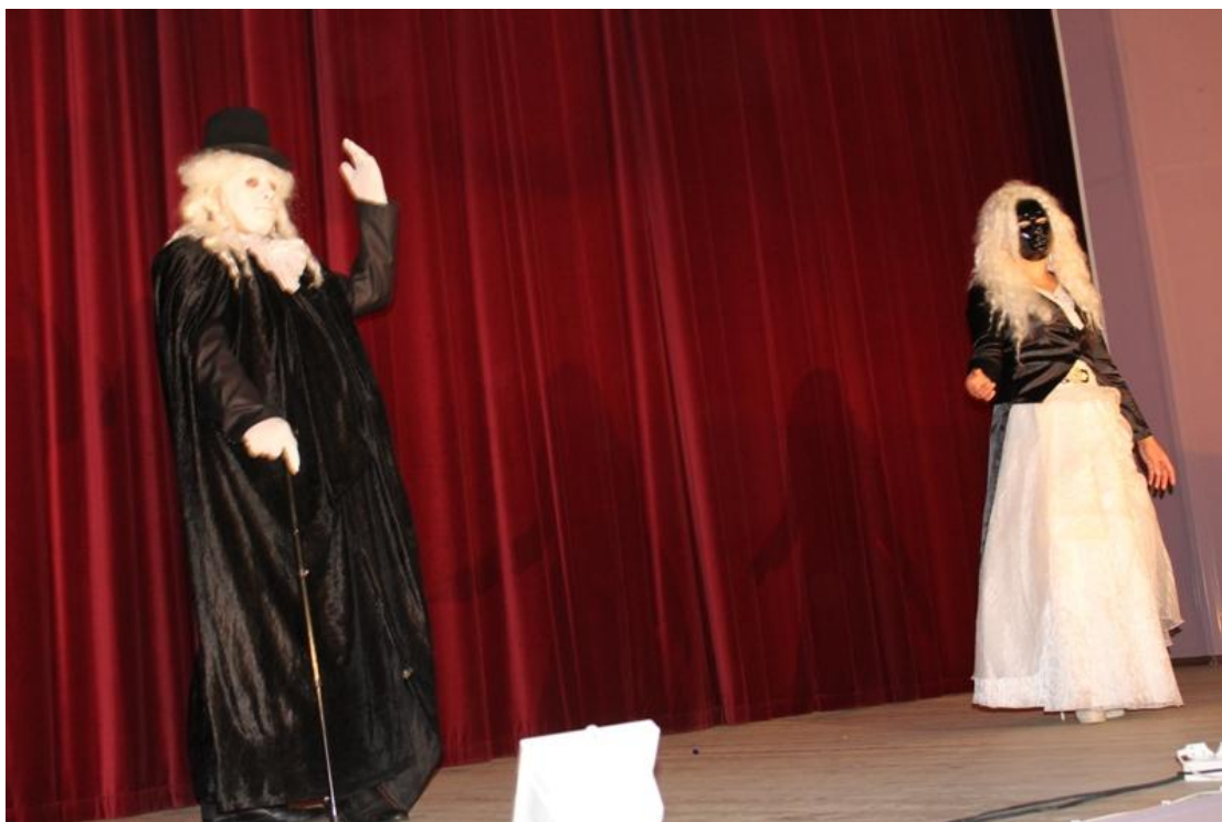
Областной фестиваль-конкурс любительских театров: «Приокские сюжеты» 10 ноября 2018 года