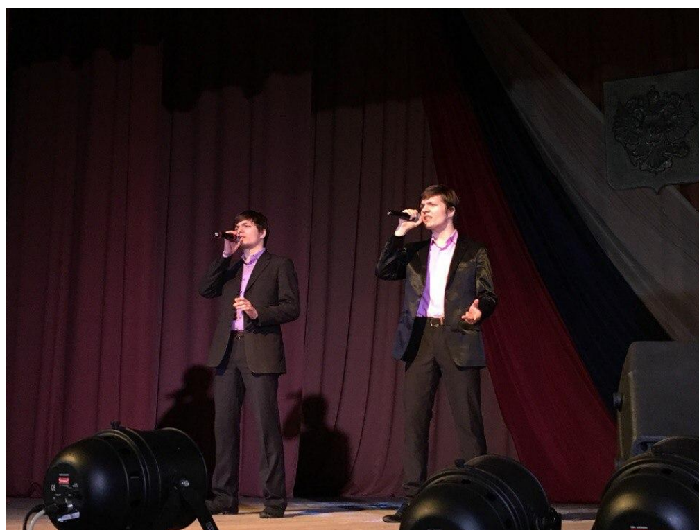
Концерт в РДК г. Боровск посвящённый 100 - летию РККА и 29- летию окончания войны в Афганистане 21 февраля 2018 года