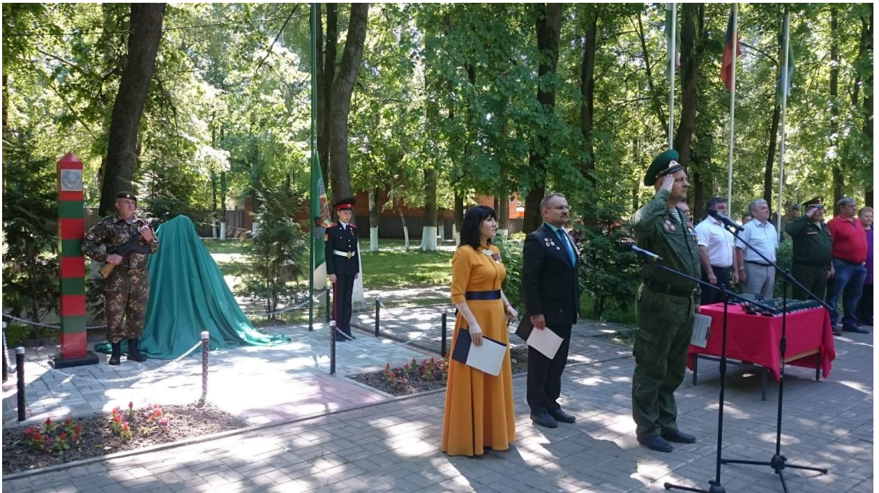
Митинг посвящённый 100 летию Пограничных войск ВЧК КГБ СССР 28 мая 2018 года