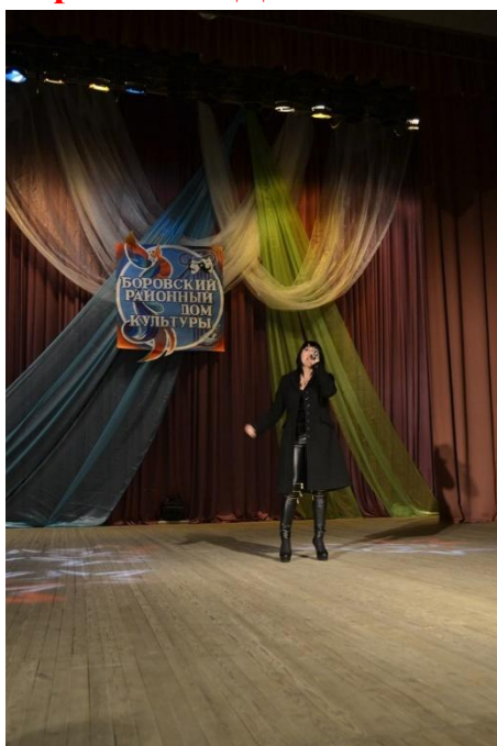
Концерт к «Дню работника культуры» 14 апреля 2018 года РДК г. Боровск