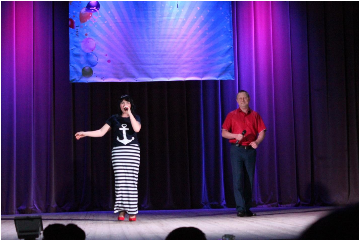
Концерт День молодёжи 28 июня 2019 года