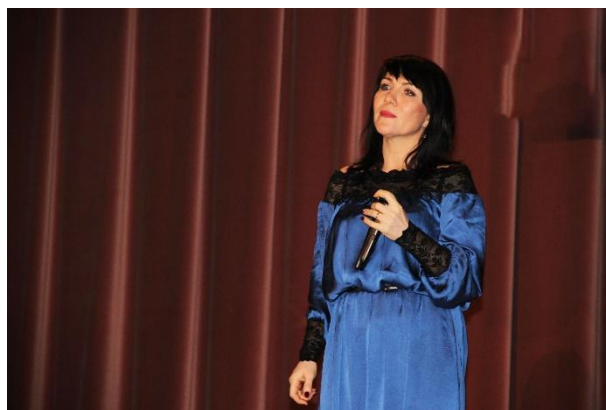
Концерт: «Защитникам Отечества!...» 23 февраля 2018 года