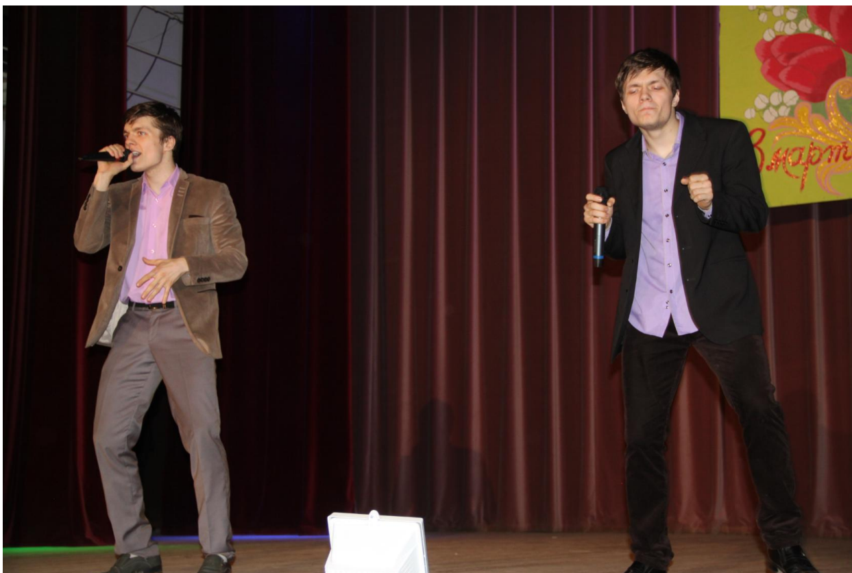
Концерт: «Весеннее настроение» 6 марта 2017 года