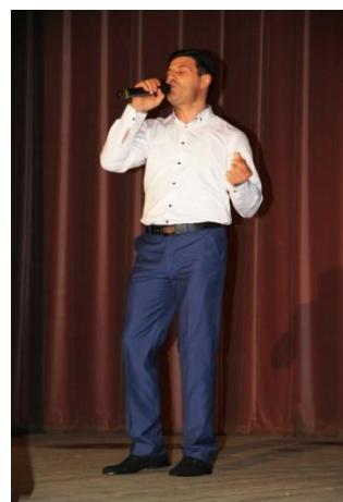
Концерт посвященный Международному женскому дню 8 марта МУК ДК «Полёт» 7 марта 2018 года.