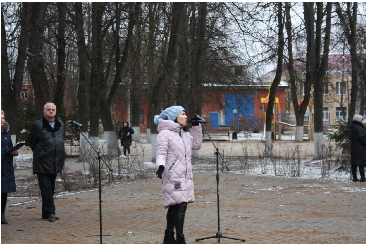
Митинг посвящённый 78-й годовщине освобождения г. Ермолино от немецко-фашистских захватчиков в декабре 1941 года 30 декабря 2019 года